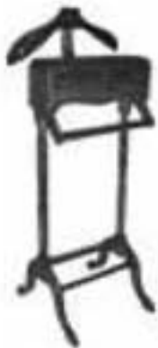
Valet pa colga panja